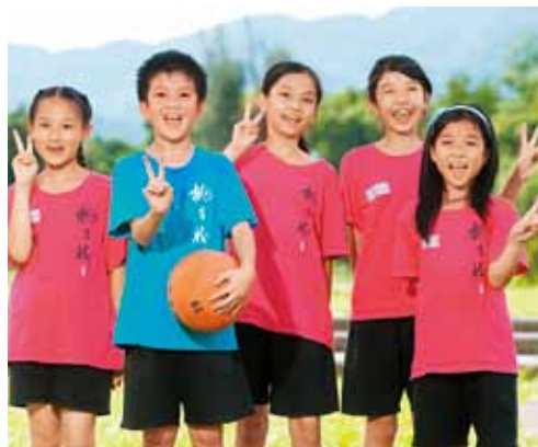
新北市桃子腳國民中小學