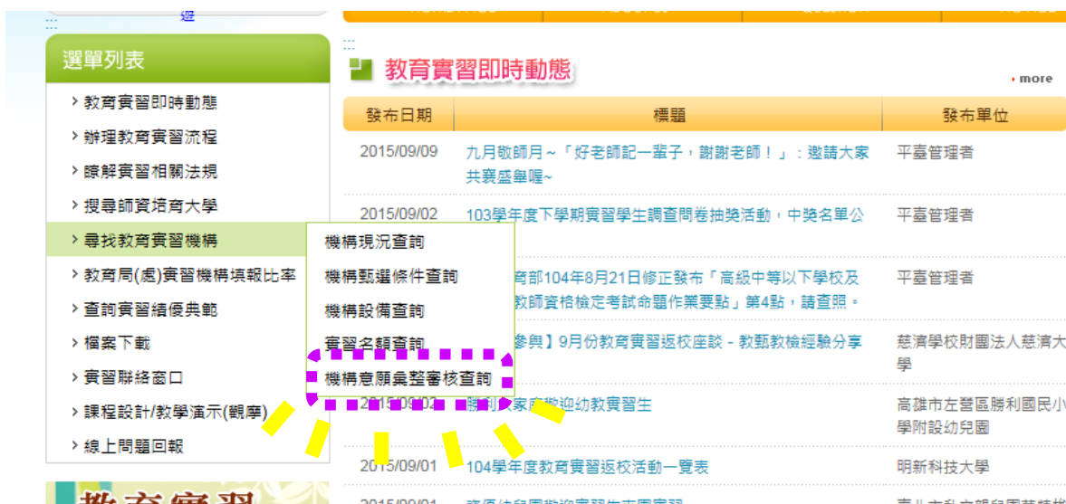
【圖示 1-2】請選擇「適合」或「可考量」之教育實習機構